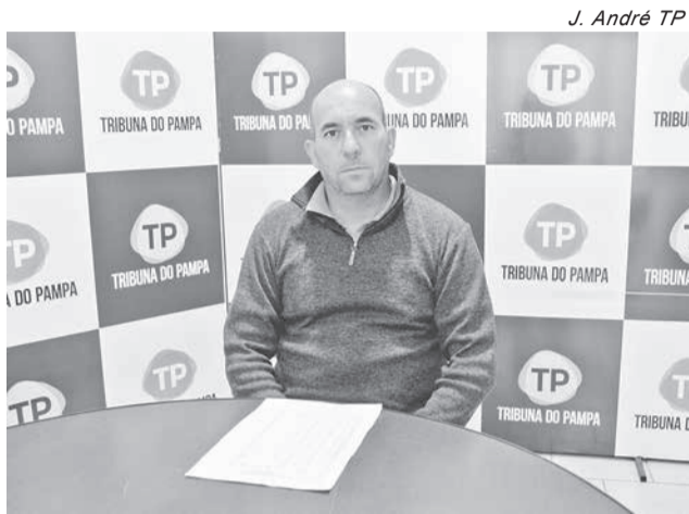
J. André TP

Um abaixo-assinado pede providências e já reúne cerca de 200 assinaturas