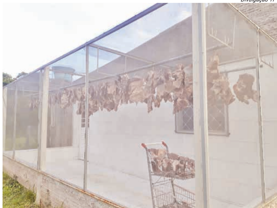
No solário, peças ficam penduradas até ficar no ponto desejado