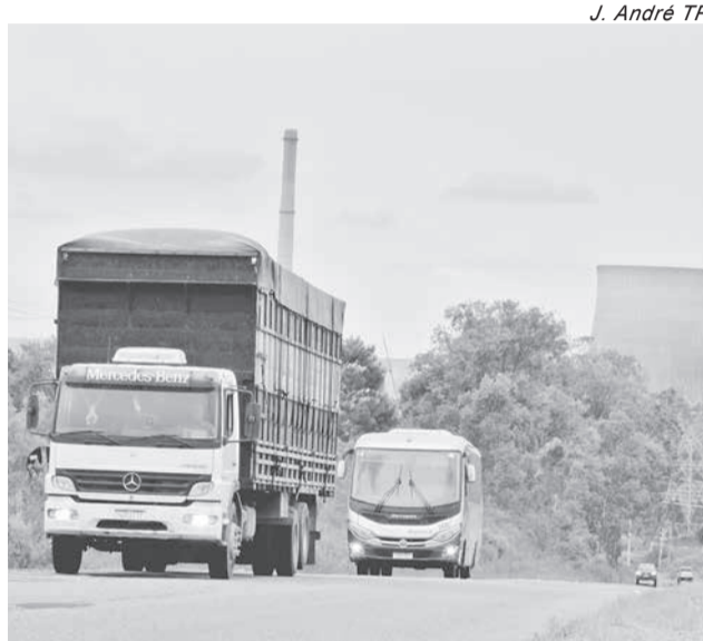
J. André TP

Construída no início da década de 1970 pela então Companhia Estadual de Energia Elétrica (CEEE), desde então a estrada jamais passou por um recu-