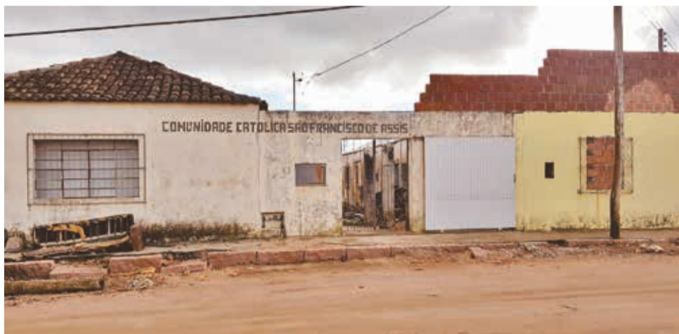
Comunidade São Francisco de Assis atualmente

O local sediará projetos para combater a criminalidade, drogadição e prostituição infantil