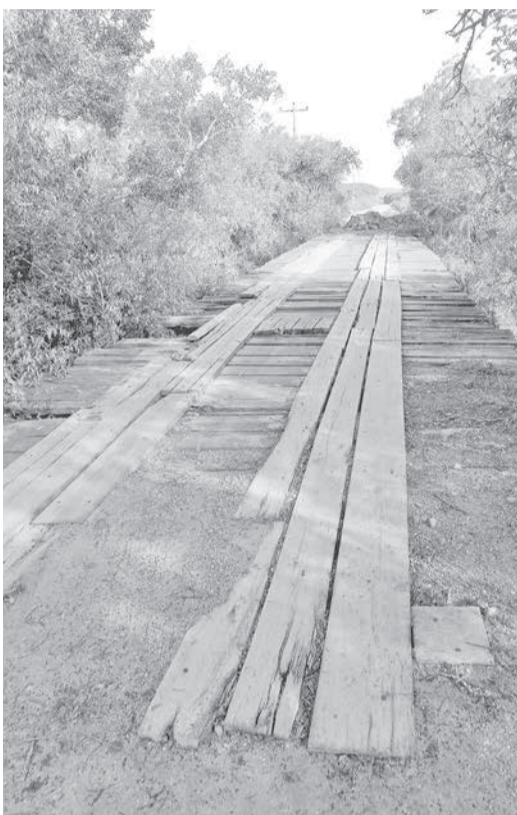
Ponte foi interditada em fevereiro deste ano