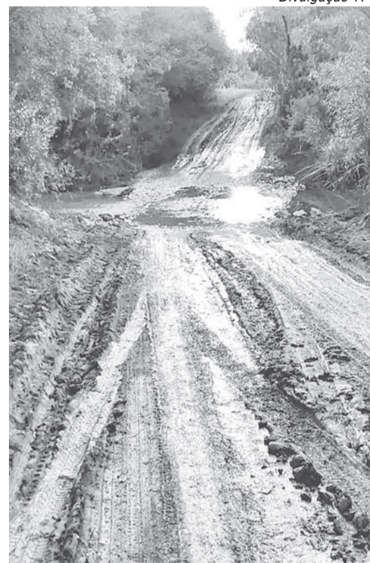
Atualmente, água passa por cima da passagem provisória, que também está com bastante barro, dificultando o tráfego