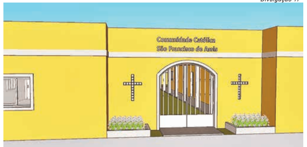
Comunidade São Francisco de Assis após conclusão da obra