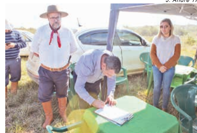
J. André TP

Para o vice pinheirense, que assinou o convênio pelo município, a situação é mais de indignação do que outra coisa. “A grande realidade é que só estamos aqui porque a ERS-608