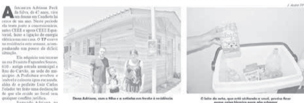
Da direita em três vezes por semana ela cuida da mãe idosa, que tem Alzheimer e diabetes. A insulina fica numa caixa com gelo. CEEB Equatorial promete resolver o caso em breve.

O TP realizou na época uma reportagem abordando a situação, publicada no dia 21 de dezembro do ano passado (foto), quando a concessionária Equatorial Energia prometeu dar uma atenção ao problema. Por ser uma região que faltava uma extensão de rede, a obra acabou se efetivando cerca de quatro meses depois.