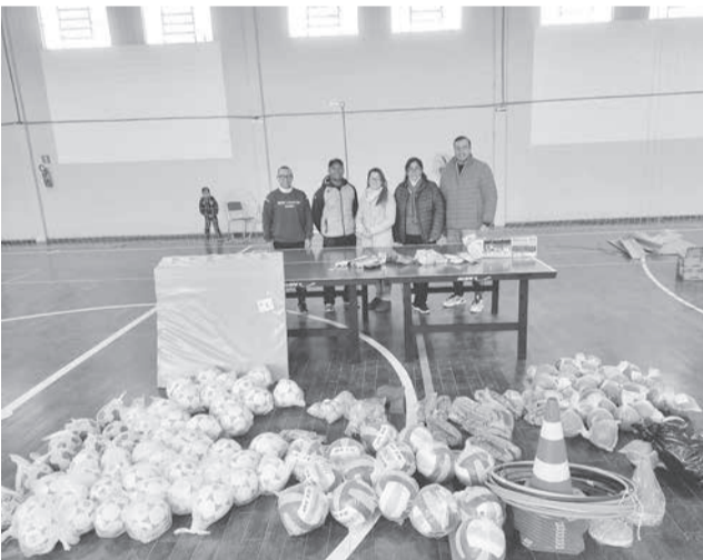
Monteiro Lobato também foi contemplada