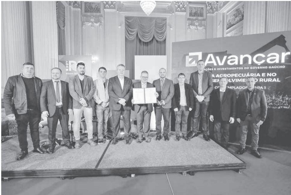
Governador Ranolfo e secretário Domingos Velho Lopes conduziram a apresentação do projeto e o ato de assinatura no Piratini