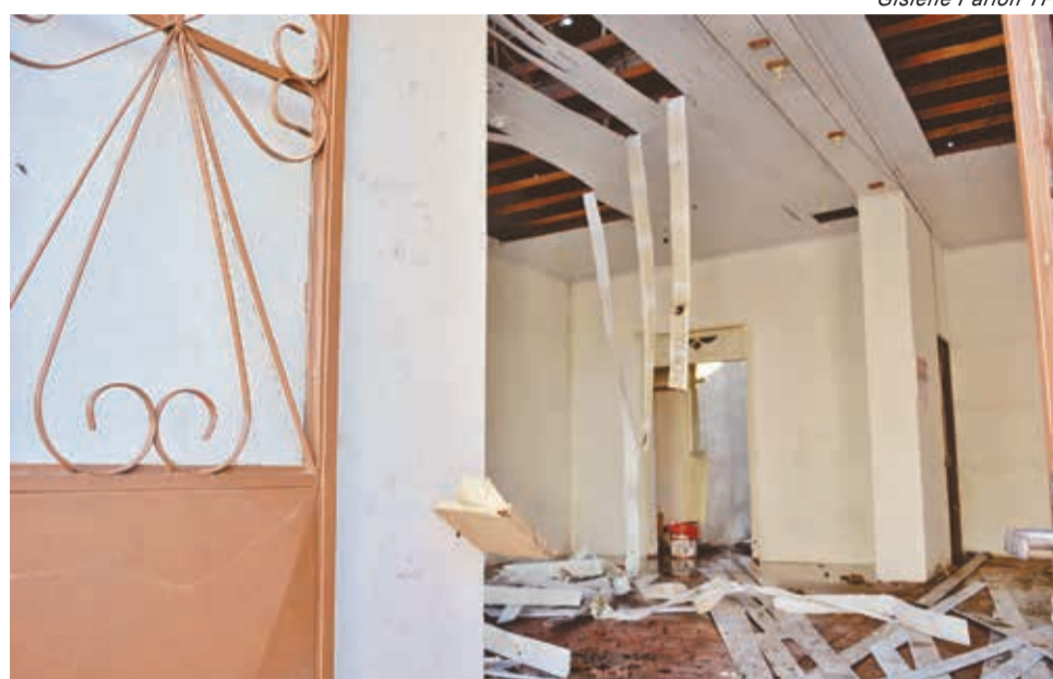
Gislene Farion TP

Ajuda de voluntários foi essencial para cessar o incêndio no centro de Pinheiro Machado