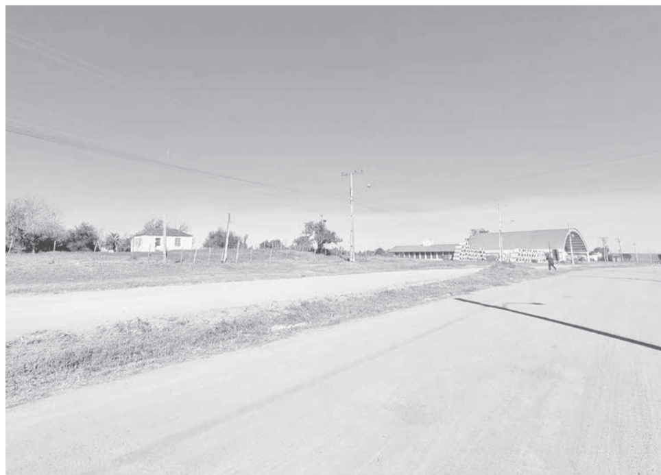
Novo loteamento será ao lado ginásio Gupa (ao fundo na foto)

providenciadas para que Pedras Altas ficasse habilitada. Então, a equipe da Central de Projetos do município, juntamente com a Secretaria de Administração, Assistência Social, permitiram que o edital e as avaliações sociais necessárias ocorres-