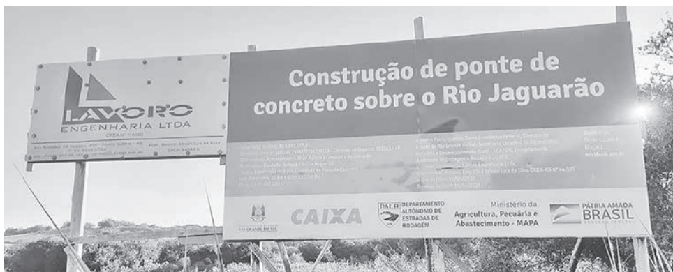
Placa da obra foi afixada em 2020 e diz que a obra terminaria em abril de 2021

As últimas informações que o TP teve acesso sobre a situação, é que o projeto tramita e deve ter a aprovação para que haja o equilíbrio e a empreiteira possa dar início de fato na obra, que em 2020 chegou até ser colocada uma placa no local, tendo sido assinada a ordem de serviço de início de obra pelo governo do Estado.