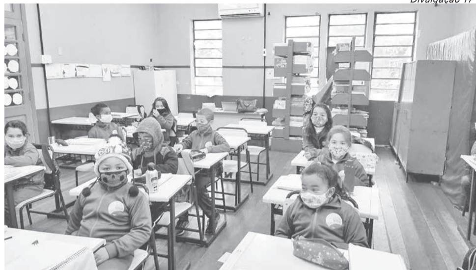
Alunos já em sala de aula com os uniformes