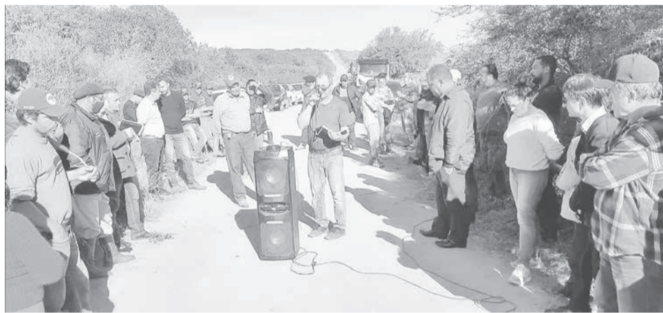
Protesto reuniu lideranças da região durante esta terça-feira (14)

ENTENDA O CASO - Com recursos garantidos desde