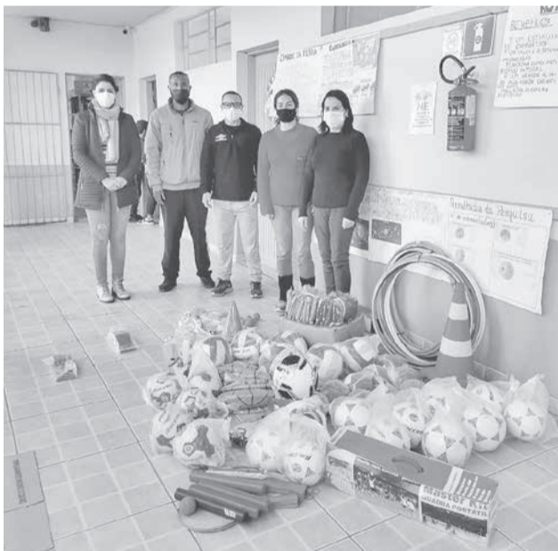
Smec também fez a entrega na Nova Esperança