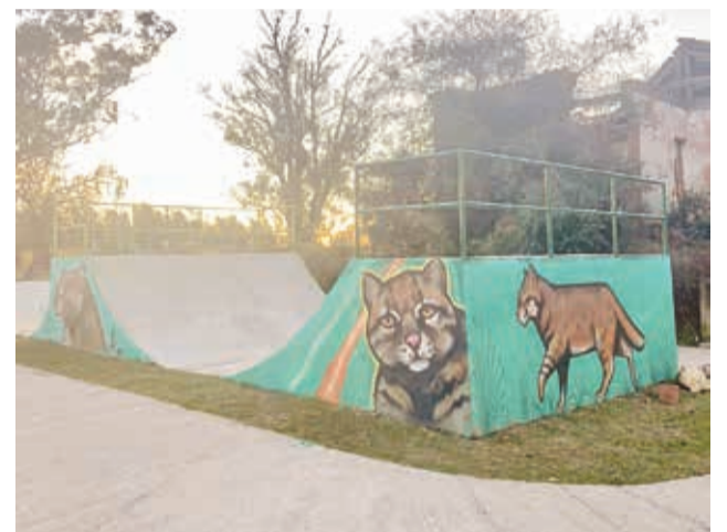
Pista de skate da praça de Seival, antes e depois da pintura