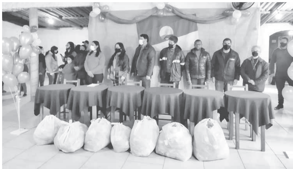
Cerimônia no PTG marcou entrega dos uniformes aos alunos