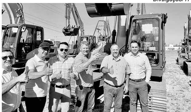
Em Pinheiro Machado o maquinário ajudará na manutenção das estradas