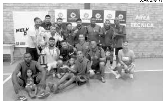
Equipe do Independente se sagrou campeã do torneio