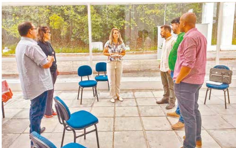
Prefeitura e Urcamp pretendem fazer uma reunião com a comunidade para tratar sobre os cursos a serem ofertados

- No Polo Educacional, sediado no Centro Cultural Candiota 1, já acontecem dois cursos técnicos à distância, sendo um de