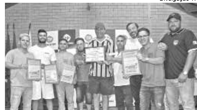
Tribuna do Pampa foi homenageado, juntamente com os barbeiros da Barber Shop Schmit