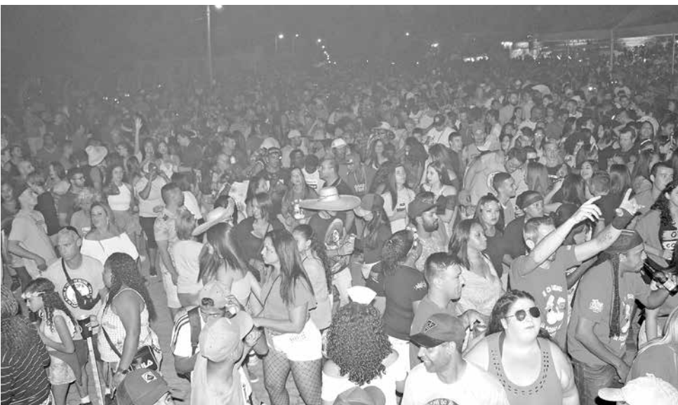
Última edição antes da pandemia foi em 2020