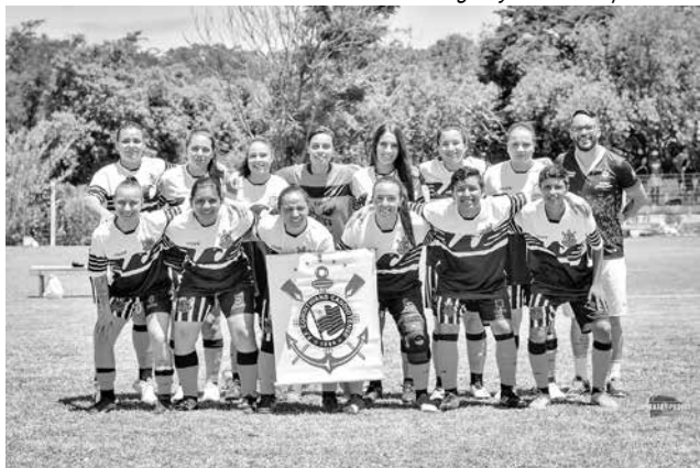
Registro da equipe na final do Gauchão Futebol 7 em 2021, quando o time ficou em 5º lugar do Estado

S e ainda hoje o futebol feminino enfrenta muitas dificuldades e barreiras, imagina há 25 anos, quando em 23 de março de 1997 foi fundada a equipe do Futsal Candioteense (FC) Corinthians.