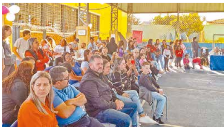
Pais e responsáveis também prestigiaram o evento