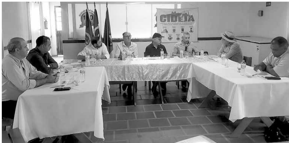
Encontro aconteceu nas dependências do Sindicato Rural de Herval

avanços e paralisações há cerca de 20 anos, quando começou a ser idealizada durante o governo estadual de Olívio Dutra (1993-2003). Nos governos da presidente Dilma Rousseff (2011-2016), a ideia, puxada pelo Cideja, avançou com mais velocidade, contudo nos anos seguintes ficou estagnada. Durante a Assembleia, por proposição do prefeito de Herval, Ildo Salaberry – que entende ser este o momento político para isso –, foi aprovada a retomada desta luta pelo Cideja.