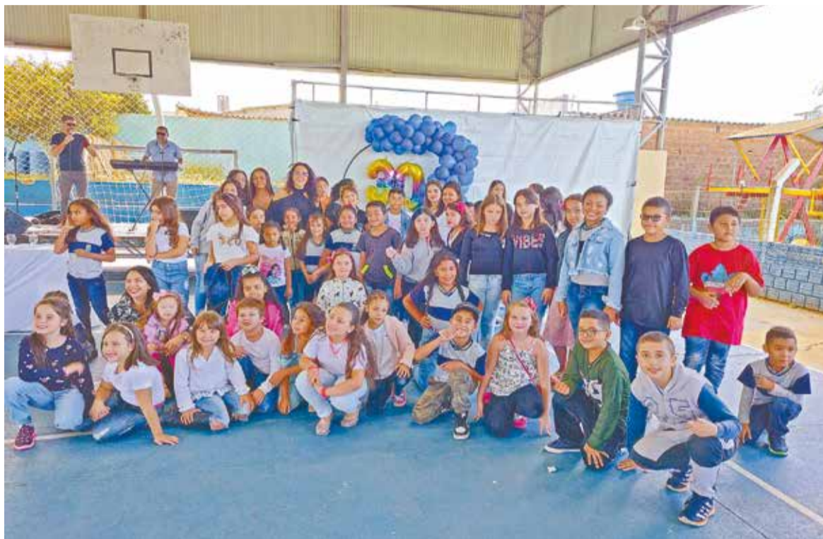
Alunos e direção celebraram as três décadas