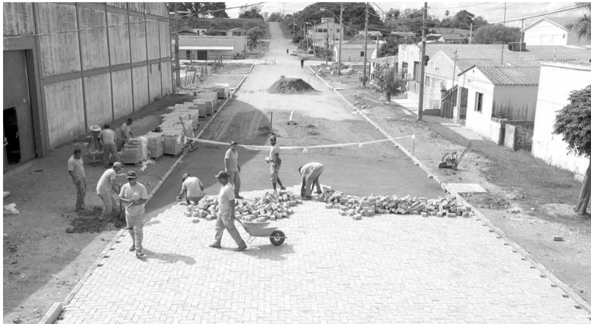
Rua central Pedro Rabione Sacco está recebendo pavimentação neste momento

“Nunca se pavimentou tanto em nosso município como nesses últimos anos”, comemora com orgulho o prefeito de Hulha Negra, Renato Machado (PP). O chefe do Executivo hulhanegrense enfatiza que as obras de pavimentação mudaram o cenário da sede do município. “Sempre reforço: a aplicação do calçamento é a última fase. Antes, tratamos a rede de esgoto, saneamento básico e questão de saúde pública”, destaca o prefeito, citando o avanço das obras na rua Pedro Rabione Sacco, na região central da cidade.