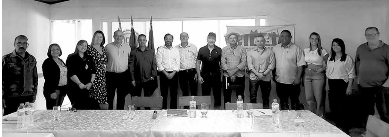
Prefeitos e representantes de seis dos sete municípios integrantes se fizeram presentes na assembleia geral