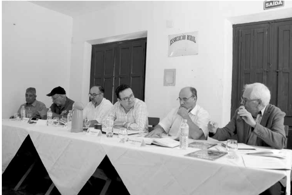
Autoridades debatem maneiras de destravar utilização dos recursos

Durante a última Festa e Feira Estadual da Ovelha (Feovelha), no fim de janeiro deste ano, um dos debates que fez eco foi o fato do próprio evento não ter recebido aporte financeiro do Fundo de Desenvolvimento da Ovinocultura do Estado (Fundovinos) em 2023. Naquele momento, foi formada uma Comissão Regional, criada pela Associação dos Municípios da Zona Sul (Azonasul) para debater a situação, ou seja, uma maior flexibilização da legislação e melhor acesso na utilização desses recursos.