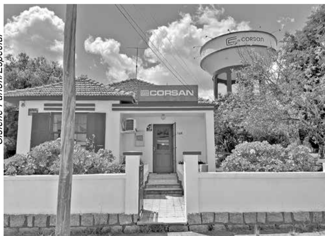
Unidade em Pinheiro Machado segue com atendimento presencial

Em relação a mudança administrativa com um coordenador e não mais com um chefe de unidade em cada local, a Assessoria respondeu que “do ponto de vista da prestação de serviço e atendimento ao cliente, a Corsan está constantemente focada em melhorar a entrega e o relacionamento com o cliente e cada vez mais avançar com serviço de qualidade”.