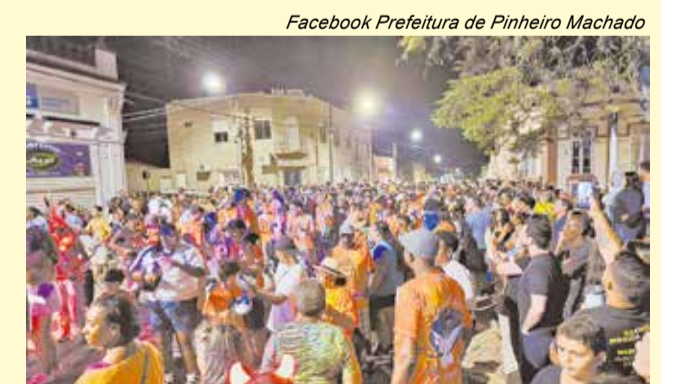
Facebook Prefeitura de Pinheiro Machado

Depois de muitos anos, Bagé voltará a ter carnaval na época, com desfiles de escolas de samba e blocos, sob a organi-