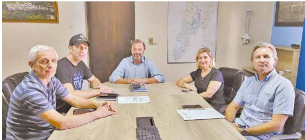
Encontro na Prefeitura esta semana selou a parceria e prefeito (C) garantiu que vai participar como atleta do evento