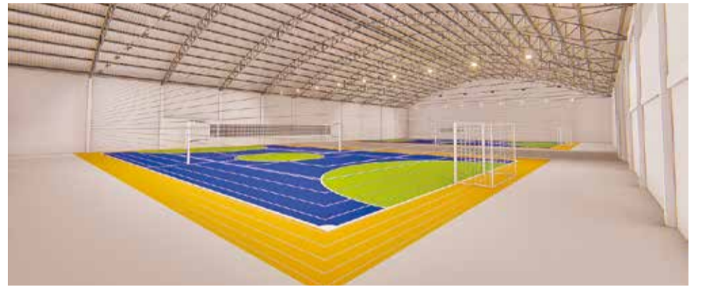
Projeto da revitalização foi aprovado esta semana

terior, o prefeito havia afirmado a necessidade de uma mudança cultural na cidade no que se refere aos espaços pú-