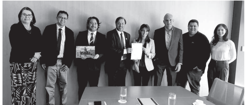
Comitiva durante reunião no Banco de Desenvolvimento da América Latina e do Caribe (CAF)