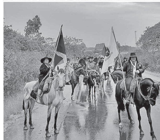
Percurso foi realizado com chuva