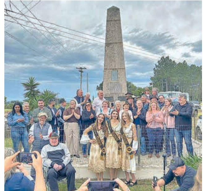
Descerramento da placa dos 100 anos da imigração alemã foi um dos momentos marcantes

O último fim de semana foi marcado por festa em Hulha Negra. Aconteceu a 20ª edição da Oktoberfest da Trigolândia, maior evento germânico da região, retomado após a última edição ter ocorrido em 2019.