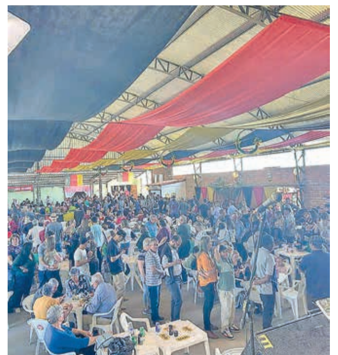
Público lotou as dependências do Clube Concórdia

paralelas que contribuíram para um maior fluxo de pessoas em Hulha Negra como o Cross Country e outros eventos religiosos que aconteceram, o que mostra a importância do turismo de eventos, que movimenta a cidade, e fortalece a cultura local. Temos algumas vantagens que não são percebidas a olho nu, como a moeda que circula no nosso comércio, nos prestadores de serviços e que é fundamental, a interação entre as pessoas em um mundo hoje guiado pela internet. Então, a Oktoberfest é mais um exemplo de turismo de evento, que traz benefícios sociais, psicológicos, psicossociais, por nos promover alegria, autoestima, integração das pessoas, o emocional, a energia que se integra, os aspectos culturais, que é evidente, e os aspectos econômicos e financeiros para a cidade”.