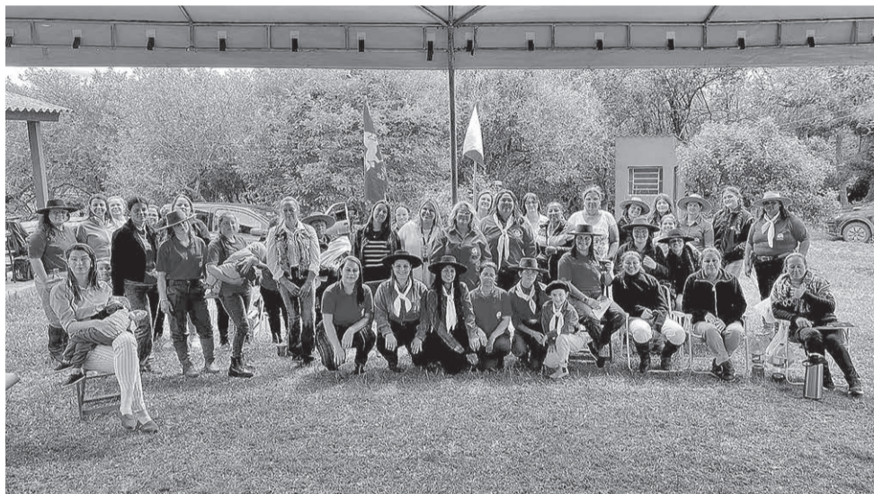
Após a cavalgada, grupo participou de atividades

Atividade também contou com palestra e agendamento de exames de mamografia para as participantes