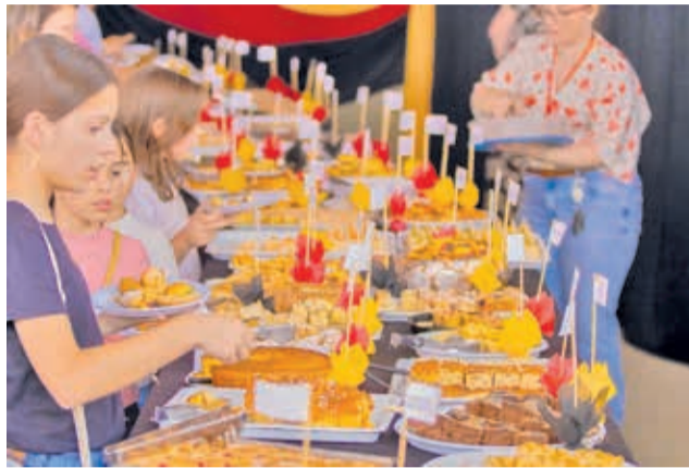
Café colonial foi uma grande atração