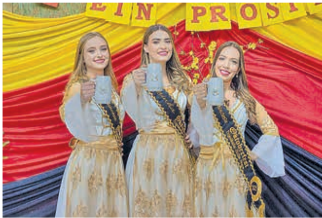
Soberanas abrilhantaram o evento

Festividade também foi um momento de comemoração do centenário da imigração alemã