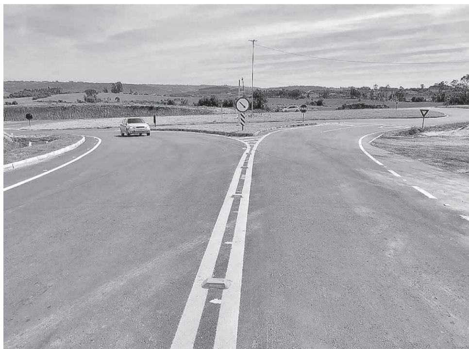
Candiota e Cerrito já foram modificados com o fechamento do cruzamento central

mulação dos entroncamentos nos acessos a Candiota (km 137,1) e a Cerrito (km 50), onde os municípios são cortados pela rodovia. No momento, as interven-