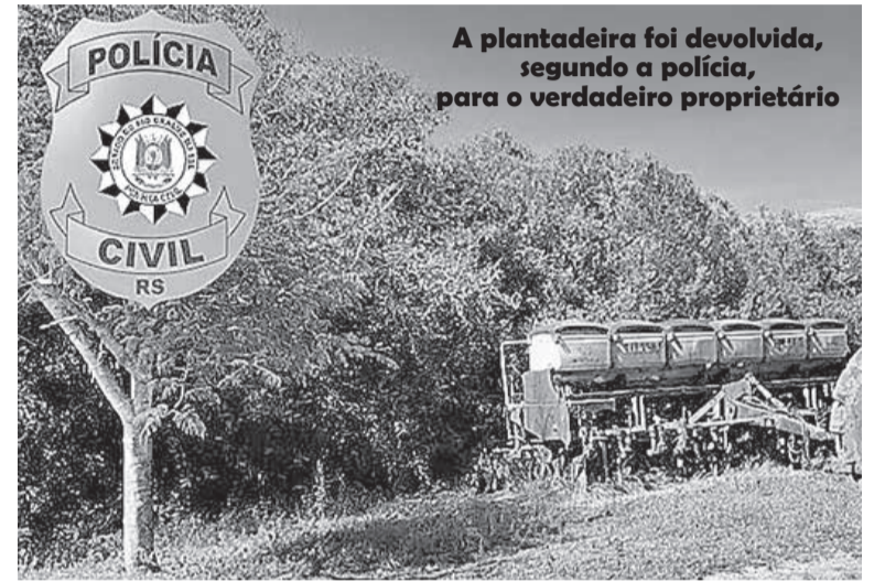
A plantadeira foi devolvida, segundo a polícia, para o verdadeiro proprietário

A Polícia Civil, por meio da Delegacia de Polícia de Candiota, com apoio da Operação Protetores de Divisas e Fronteiras (Aceguá), cumpriu na manhã desta terça-feira (18), um mandado de busca e apreensão expedido pela 2ª Vara Criminal da Comarca de Bagé, no âmbito de investigação relacionada ao crime de apropriação indébita de maquinário agrícola na região.