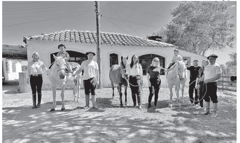
Primeiro contato com o projeto e equinos aconteceu no início da semana

A secretária de Assistência Social, Criança,