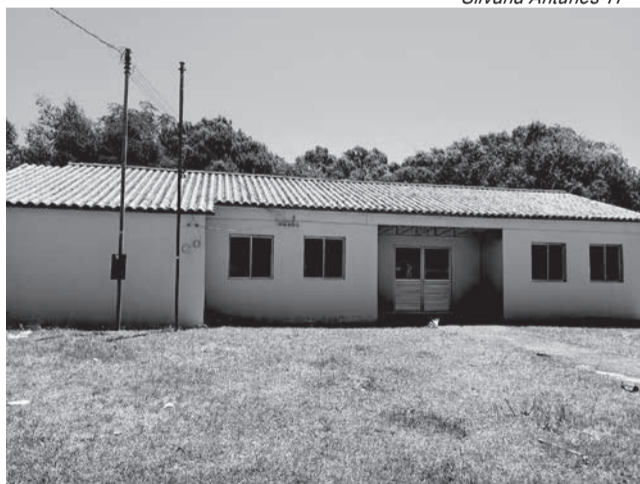
Espaço ainda precisa de energia elétrica e outros reparos