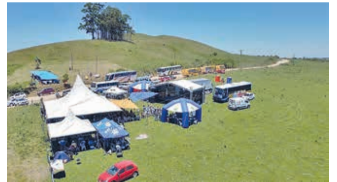
Uma grande estrutura foi montada no local para sediar o evento