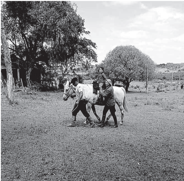
Alguns alunos já deram uma pequena volta nos animais para se familiarizar

to. Para os pais, ver seus filhos progredindo é como sentir o coração respirar aliviado. É perceber que cada sorriso no dorso do cavalo é uma conquista. É ganhar esperança, renovar forças e entender que o desenvolvimento não precisa ser apressado, ele acontece no tempo certo, com amor, paciência e apoio. A equoterapia transforma. Ela fortalece músculos, melhora o equilíbrio, estimula a fala, a concentração e a autonomia. Mas, acima de tudo, ela acolhe. Acolhe a criança, com suas necessidades e potencialidades, e acolhe a família, que encontra ali um espaço de compreensão, carinho e crescimento conjunto”, finalizou.