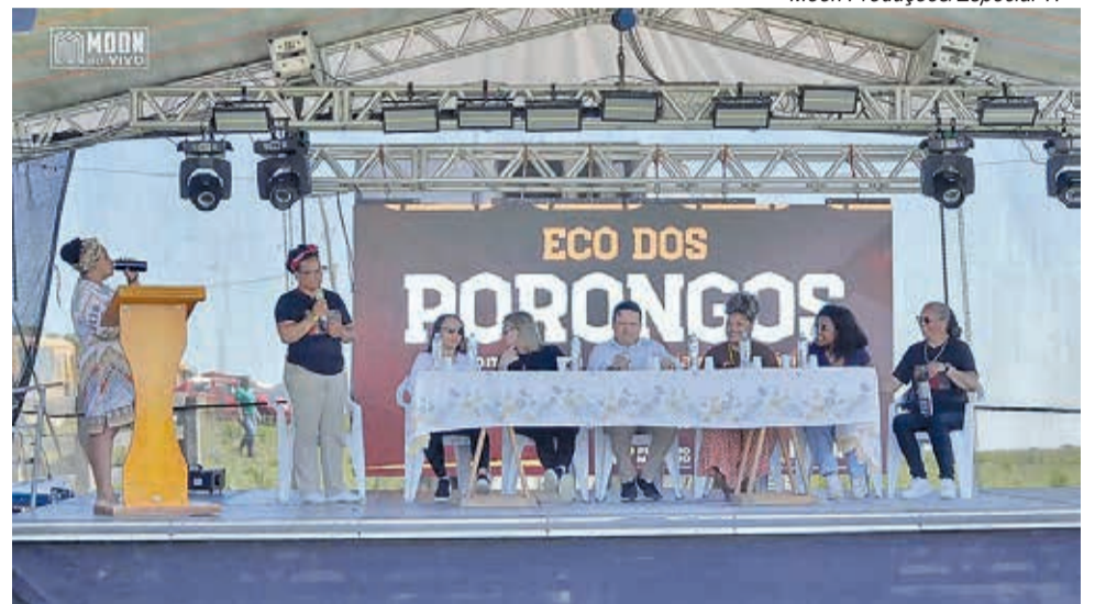
Evento reuniu autoridades, artistas e comunidade no Sítio Porongos