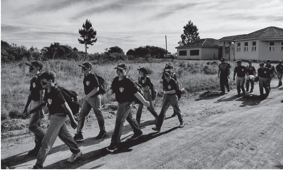
Grupo iniciou a atividade percorrendo mais de 8km de estrada até parque aquático

O sábado (15) foi de intensas atividades para os alunos do Pelotão Mirim de Pinheiro Machado. O grupo participou de um dia de campo, partindo do QG do Pelotão no Pensionato da Paróquia Nossa Senhora da Luz, com destino ao parque aquático Gaya Park, percorrendo um total de 8,5 km de marcha, feito em formação, com cantos de canções militares e realização de atividades lúdicas.