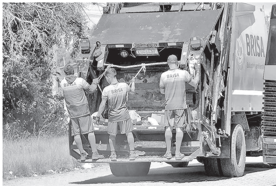
Empresa atuará na sede do município, inicialmente duas vezes na semana

um serviço terceirizado, especializado. A coleta da Brisa, que é a empresa que foi contratada com a devida licitação, transparência, com a legalidade, agora é nossa parceira e