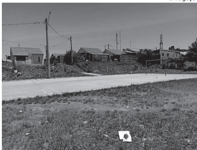
Quadra esportiva da comunidade vai receber reforma