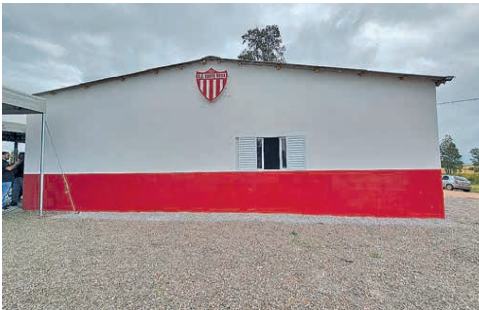
Espaço vai ser utilizado também para a comunidade

Complexo Jair Coutinho foi construído pela Seival Sul Mineração e Prefeitura de Candiota junto ao campo do Grêmio Esportivo Santa Rosa