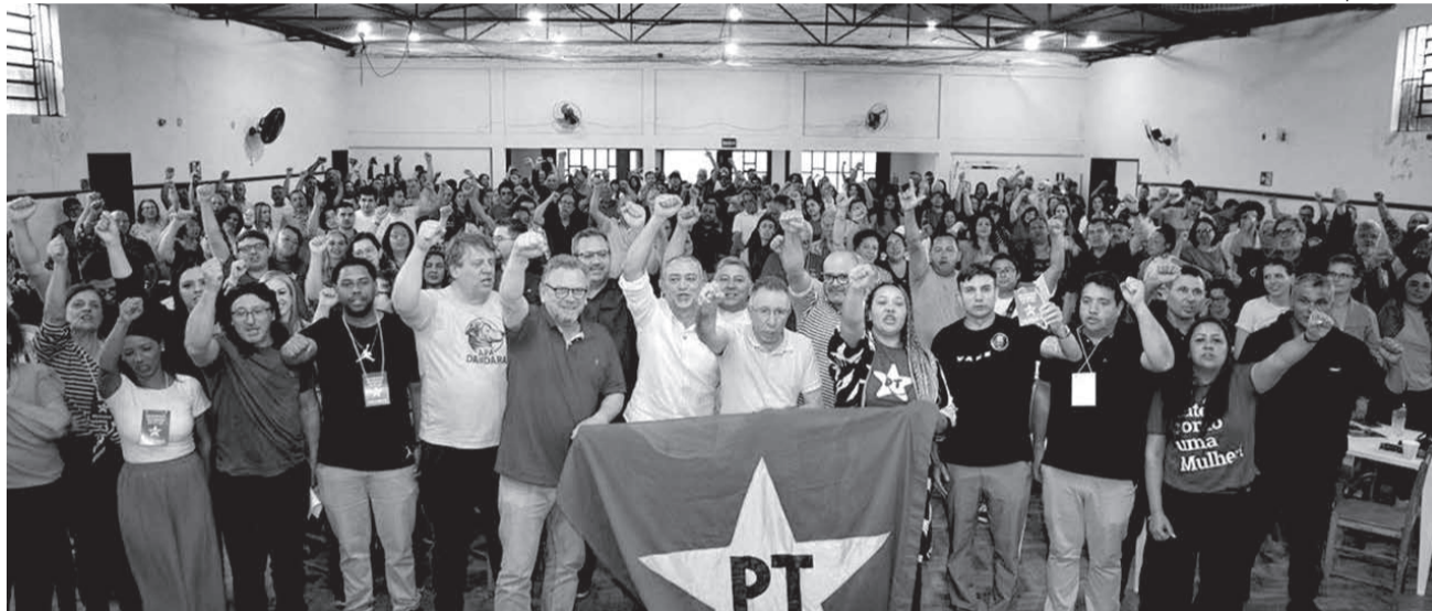
Encontro aconteceu em Bagé reunindo diversas lideranças

Segundo estimativa dos organizadores, cerca de 400 pessoas estiveram no salão da Paróquia da Sagrada Família, em Bagé, neste domingo (16), para acompanhar o encontro regional Partido dos Trabalhadores (PT). Participaram dirigentes e militantes de Bagé, Dom Pedrito, Lavras do Sul, Aceguá, Candiota e Hulha Negra.