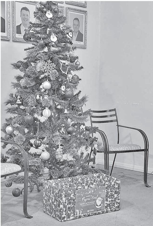
Árvore está localizada dentro da Prefeitura e uma caixa foi deixada para as cartas

Comunidade já pode retirar pedidos de crianças da rede municipal e participar do Super Natal de Pinheiro Machado