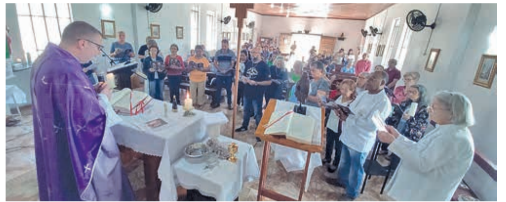
Abertra da semana contou com distribuição de santinhos aos catequistas e preparação para o Natal das famílias

INSPIRE-SE. CONECTE-SE. EVOLUA. E CONHEÇA A FORÇA DO JORNALISMO LOCAL!