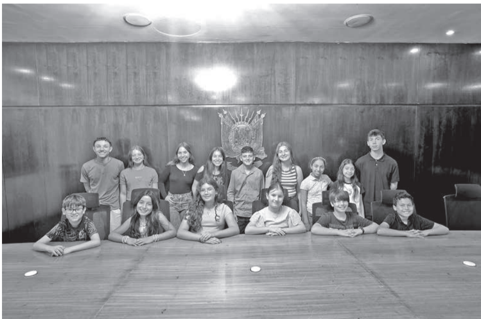
Estudantes/vereadores e vereadoras na Assembleia Legislativa do RS