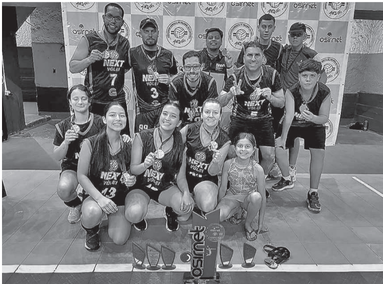
Equipe iniciante se sagrou campeã

A equipe candiotense de voleibol, se sagrou campeã na categoria iniciante na etapa de Bagé do campeonato da 1ª Liga da Fronteira de Vôlei. Os jogos foram disputados no último final de semana nos ginásios do Sesc e no Militar.