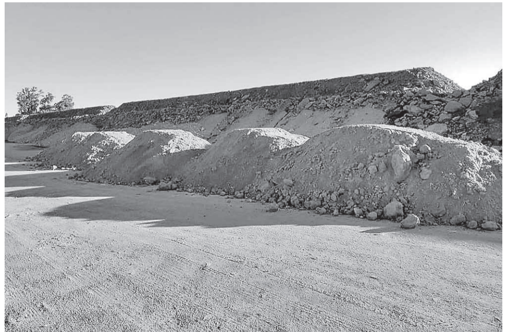
Cargas de material da saibreira são depositadas no desvio construído junto a estrada principal