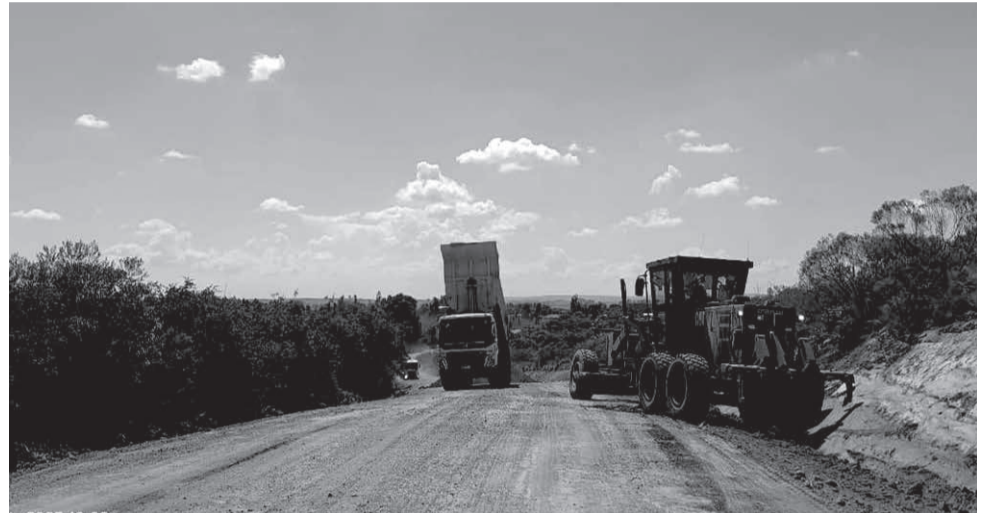
Manutenção na estrada acontece com frequência