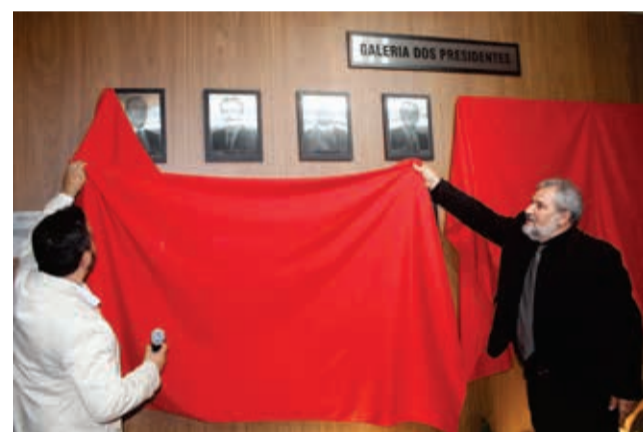
Galeria de ex-presidentes foi reinaugurada em espaço totalmente remodelado

lado sob o projeto da Aurus Arquitetura, a execução da obra pela PMZ Construções e os móveis planejados feitos pela PSG Marcenaria - todas empresas genuinamente candiotenses, o hall de entrada da Câmara acolheu a