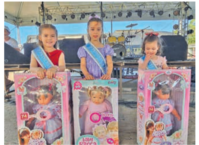
Princesas e Boneca da festa 2025

Com a presença dos freis Tiago e Paulo, a procissão começou pelo Ginásio de Esportes Lucas Porciúncula e foi finalizada