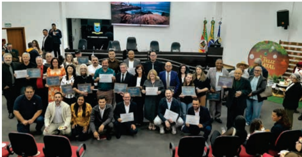
Ao longo dos últimos 33 anos, 54 homens e mulheres assumiram uma cadeira na Câmara e Candiota e todos foram homenageados na sessão especial

Reinauguração da galeria de ex-presidentes e de obra de arte marcaram homenagens aos 59 vereadores e vereadoras que fazem e fizeram parte da Câmara candiotense ao longo dos últimos 33 anos