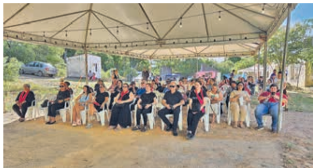
Estrutura foi montada receber o público