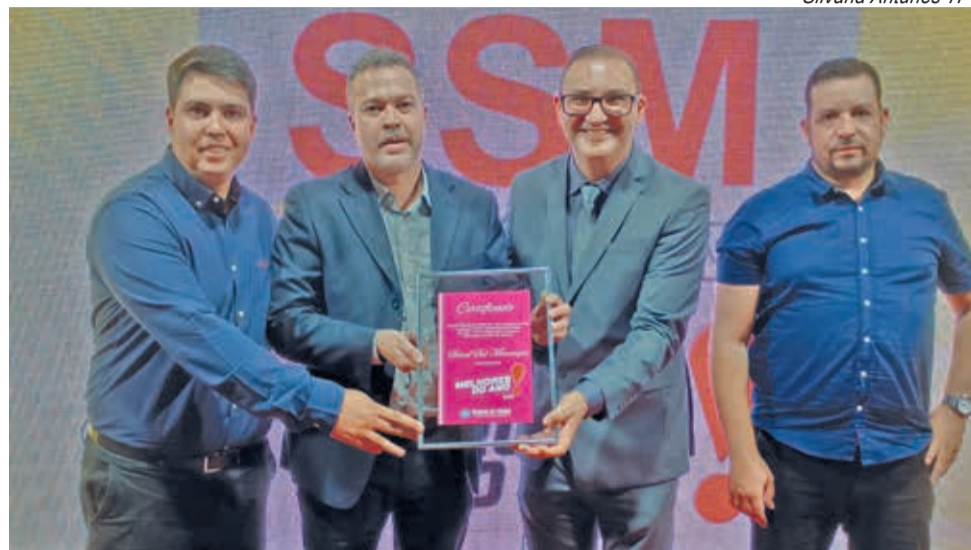
SSM recebeu homenagem pela parceria com o jornal e o evento

P ela 17ª edição, a premiação Melhores do Ano, realizada pelo jornal Tribuna do Pampa , aconteceu de forma brilhante no CTG Candeiro do Pago, em Candiota. O evento, que tem por finalidade, premiar autoridades, profissionais liberais e empresas escolhidas pela comunidade como os melhores em suas categorias, entregou os certificados a mais de 50 vencedores, que juntos com outros que não puderam estar presentes na solenidade ou não adquiriram o pacote de mídia completo, chegou a 67 premiações entre os municípios de Candiota, Hulha Negra, Pedras Altas e Pinheiro Machado.