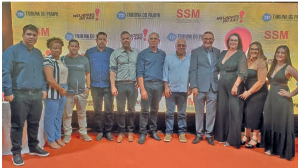
Direção do TP e autoridades regionais