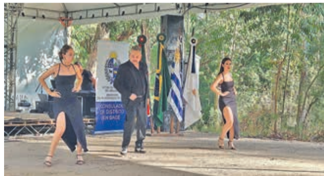
Apresentação de tango foi atração