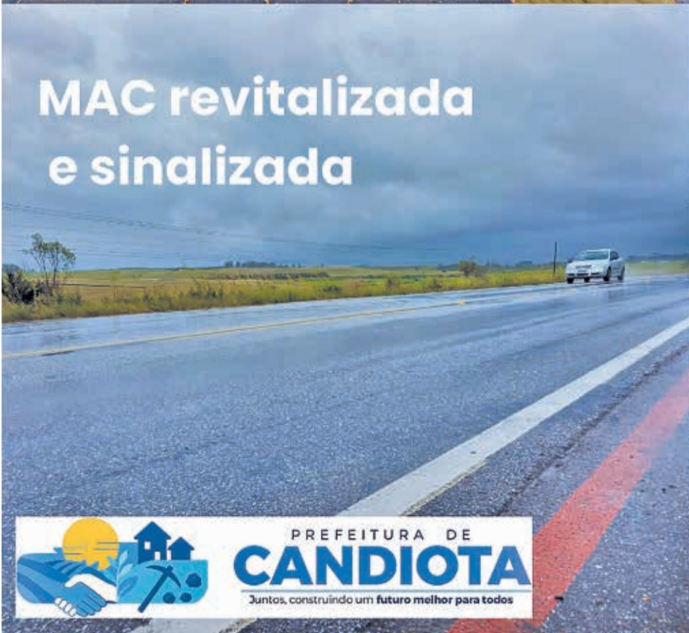
MAC revitalizada e sinalizada