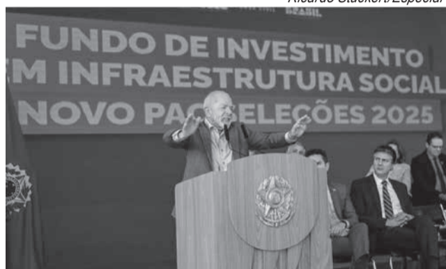
Anúncio foi feito pelo presidente Lula