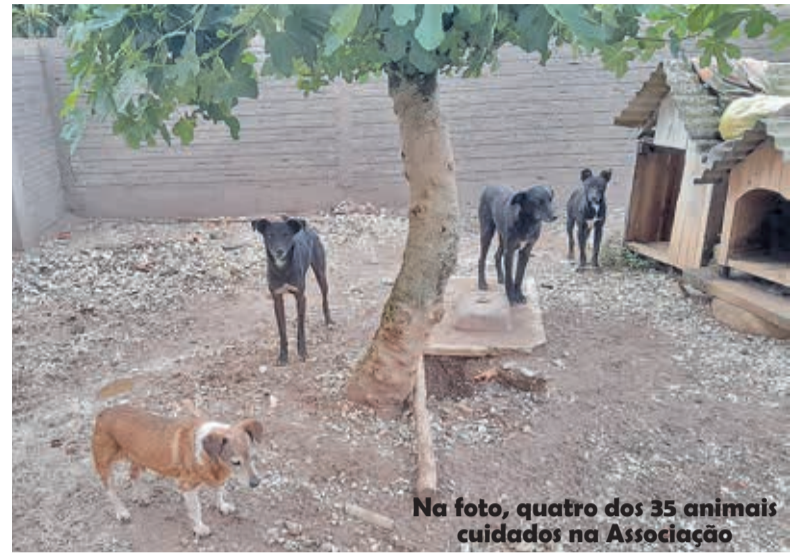
Na foto, quatro dos 35 animais cuidados na Associação