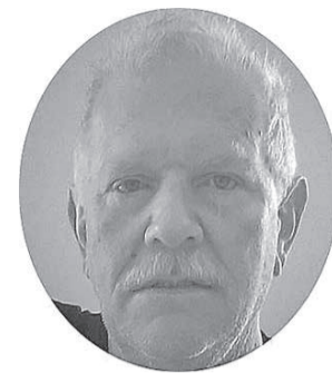
Odilo Dal Molin

No nosso lindo país o presidente de todos nós é um ex-presidiário. De torneiro mecânico a presidente, foi consagrado gênio da política, líder de um lindo país e tornou-se rapidamente poderoso. Mágica?