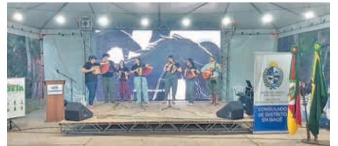
Fábrica de Gaiteiros foi uma das grandes atrações