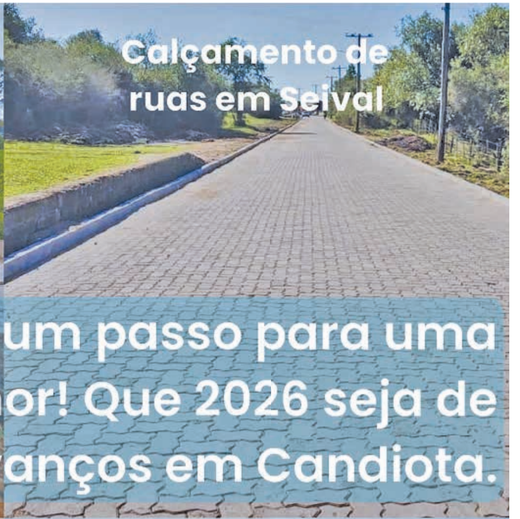
Calçamento de ruas em Seival

Cada obra é um passo para uma cidade melhor! Que 2026 seja de mais avanços em Candiota.