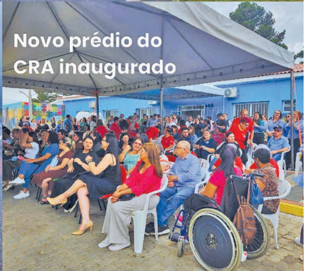
Novo prédio do CRA inaugurado