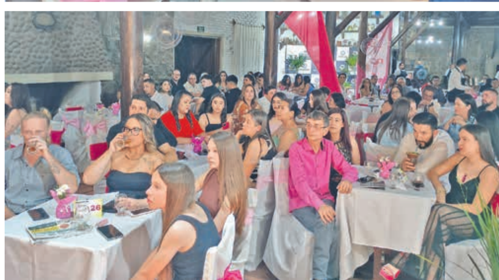
CTG Candeiro ficou lotado com o evento de entrega das premiações