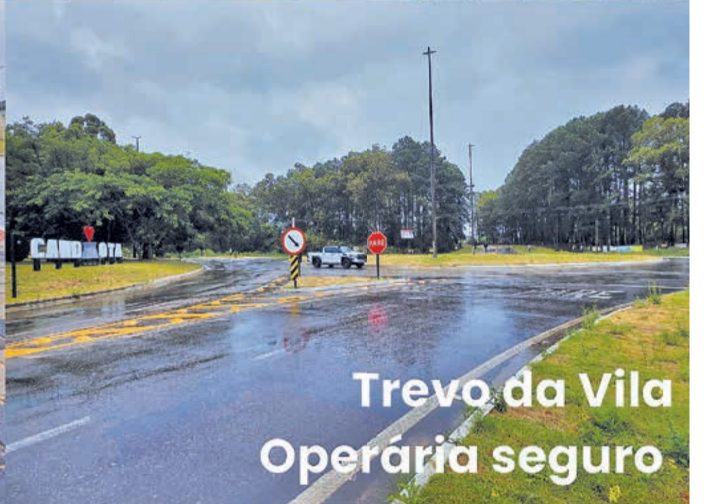
Trevo da Vila Operária seguro