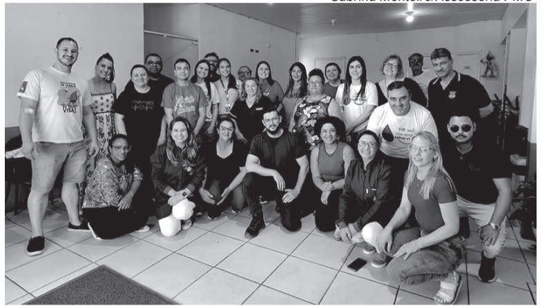
Equipe da Saúde comemorou a ação

Durante o último sábado (6), a Prefeitura de Candiota por meio da Secretaria de Saúde e em parceria com o Hemocentro de Pelotas, realizou a 6ª Campanha de Doação de Sangue no município. Contabilizando mais de 70 pessoas cadastradas para fazer a doação, a Campanha foi realizada na Unidade de Saúde Dario Lassance, localizada na sede do município e foi considerada um sucesso por toda equipe envolvida.