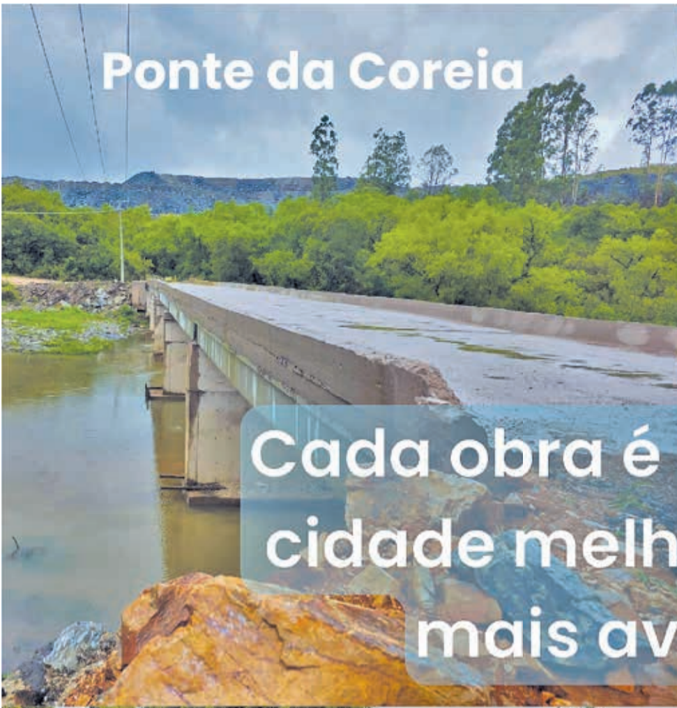
Ponte da Coreia