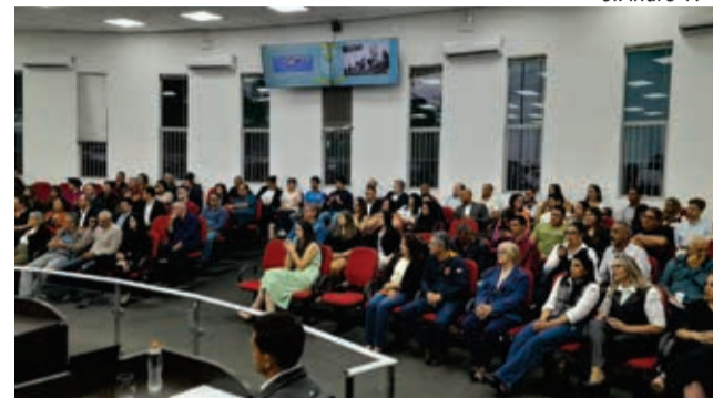
Plenário Gregório ficou lotado para a cerimônia