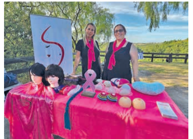
Grupo uruguaio "Mujeres celebran la vida", que fazem trabalho com pessoas com câncer, estiveram presentes também com perucas