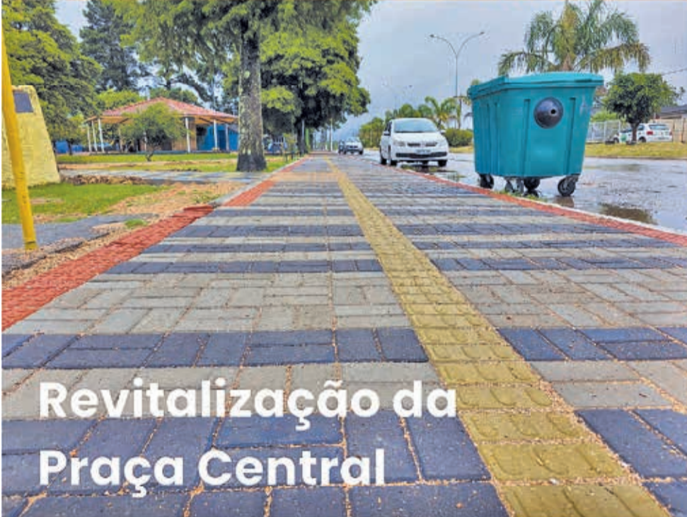
Revitalização da Praça Central

Cada obra é um passo para uma cidade melhor! Que 2026 seja de mais avanços em Candiota.