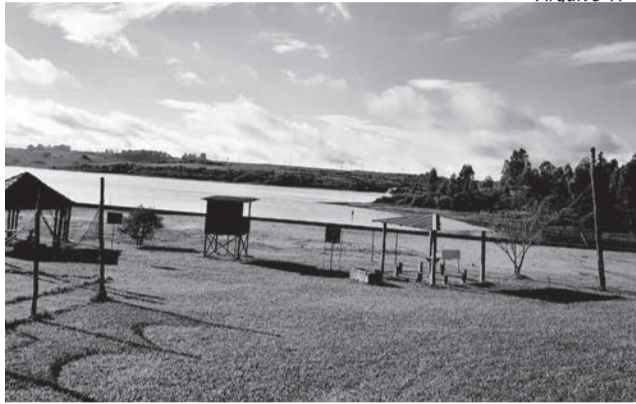
Uma rede de adução de água será implantada da Prainha até a ETA da sede do município

Com um recurso de R$ 9,9 milhões, um dos principais projetos beneficiados da Prefeitura de Candiota, segundo divulgado pela assessoria, é a implantação de um sistema de adução de água bruta que interligará o reservatório da CGTEE (Prainha) até a Estação de Tratamento de Água (ETA) da sede do município. Com isso, cerca de 8 mil habitantes, tanto da zona urbana como também da rural, passam a ter o reforço de água bruta captada do Arroio Candiota. O projeto aprovado também contempla uma rede adutora com extensão de 9,45 mil metros que interligará a rede existente no assentamento 22 de Dezembro aos acessos do Cerros, Paraíso, Corredor dos Arce e Pátria Livre. Deste ponto, será executada uma rede com mais 5 mil metros que interligará a Madrugada e