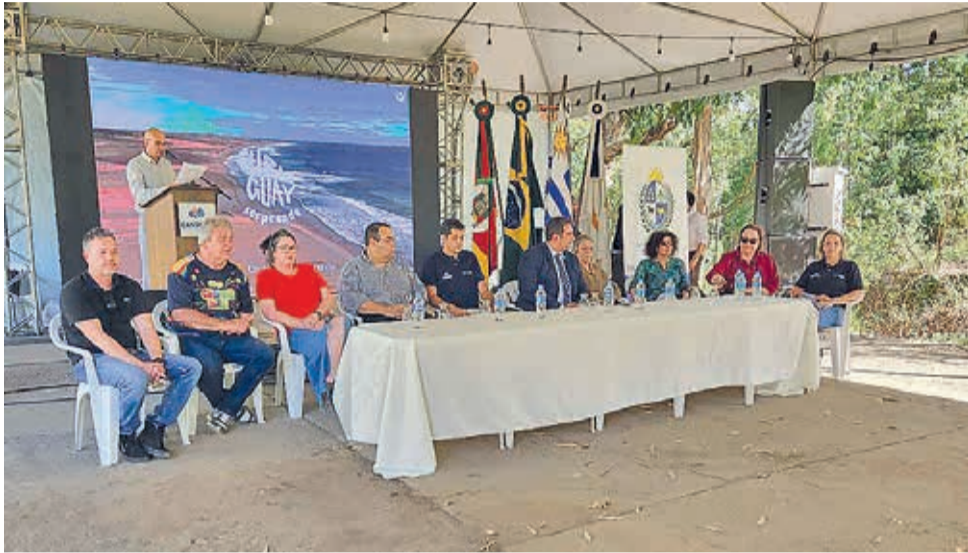
Autoridades se uniram para o evento

O sábado (6) foi de evento no mais tradicional ponto turístico de Candiota, o Mirante do Básico. O local foi palco das comemorações do Bicentenário do Uruguai, que contou com organização da Prefeitura de Candiota, do Consórcio Público Intermunicipal de Desenvolvimento Econômico, Social e