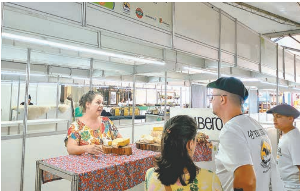
Pavilhão da agricultura familiar, novamente deverá ser um dos destaques

Além dos julgamentos, abertura de pavilhões e reuniões, programas de rádio serão realizados diretamente do Parque Charrua.