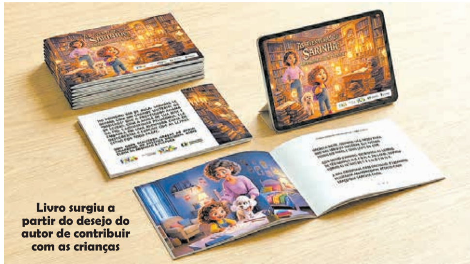
Livro surgiu a partir do desejo do autor de contribuir com as crianças

Obra foi financiada pelo PNAB e está disponível também em versão digital