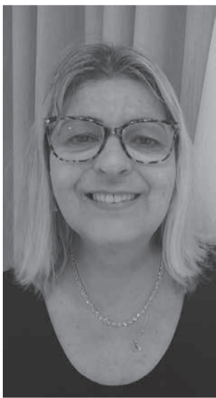
Lúcia Barcellos foi vice-prefeita de 2005 a 2008

No fim da última semana, na condição de vice-prefeita, Laura Ratto assumiu interinamente o cargo de prefeita. Antes, no período de 2005 a 2008, Lúcia Barcellos, também como vice assumiu algumas vezes