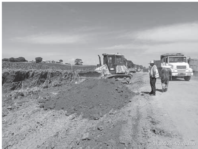
Terraplanagem, limpeza, escavação de cortes e aterros estão sendo realizados na ERS-265