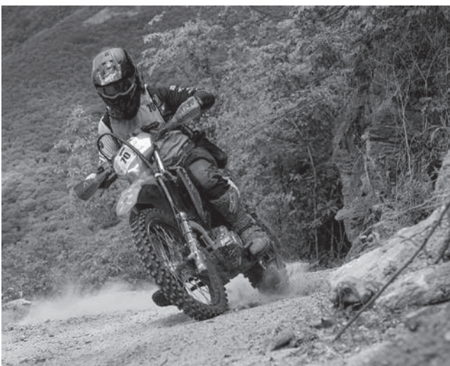
Competição reúne os melhores do país e visa também o turismo regional