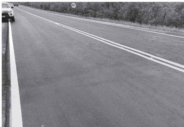
Trecho já asfaltado do Lote na ERS-608

A obra está sendo executada pelo Daer e tem previsão de conclusão até 2027. Segundo a Assessoria de Comunicação do Departamento, até o momento, foram executados trabalhos de terraplenagem, tais como limpeza da faixa de domínio, escavação de cortes e execução de aterros, realizados entre os km 84 e 85,5 da estrada.