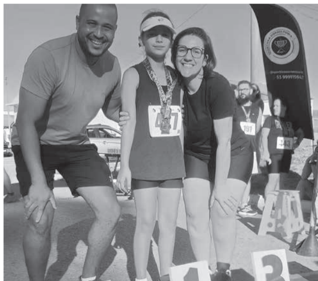
Competição reuniu público diversificado

O desportista também lembrou que eventos de esporte movimentam a economia. “Significa o comércio girando, serviços sendo movimentados e o município recebendo pessoas. Isso é desenvolvimento acontecendo na prática. O esporte vai muito além da atividade física. Ele transforma vidas, cria disciplina, pertencimento e hoje também movimenta a economia de Candiota”, pondera.