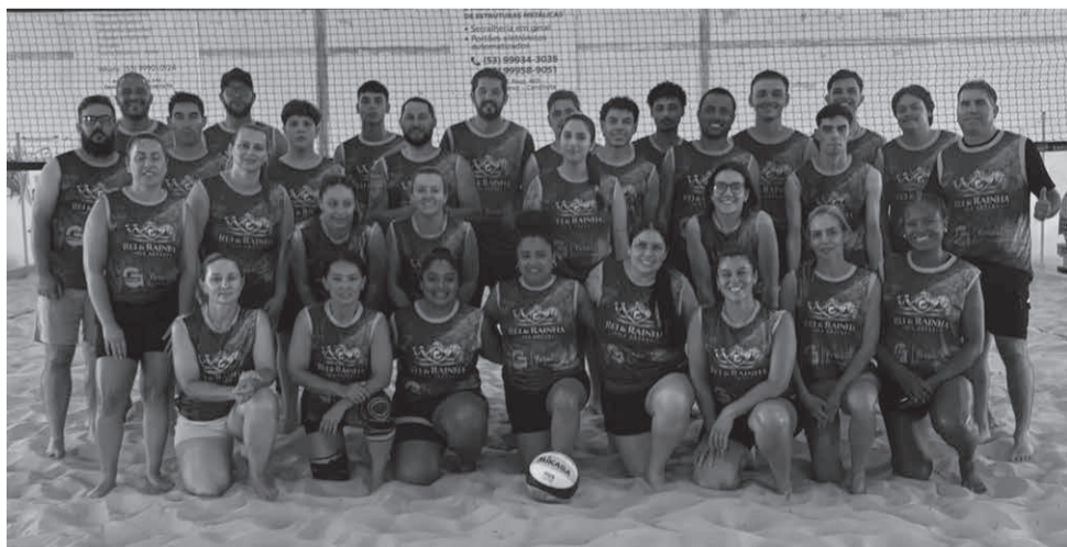
Torneio de vôlei também movimentou a cidade esportivamente