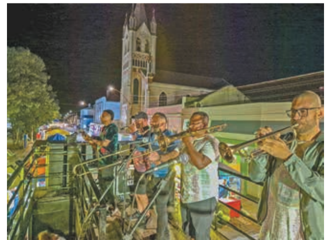
Músicos "levantaram" os foliões que lotaram a área central da cidade

Nós cuidamos do lixo e ajudamos a cuidar do planeta!