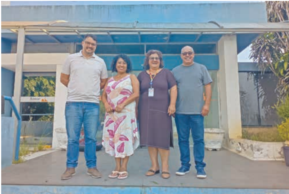
Autoridades comemoraram a autorização de utilização do prédio

Visita técnica visou definir adequações necessárias no espaço para abrigar a escola