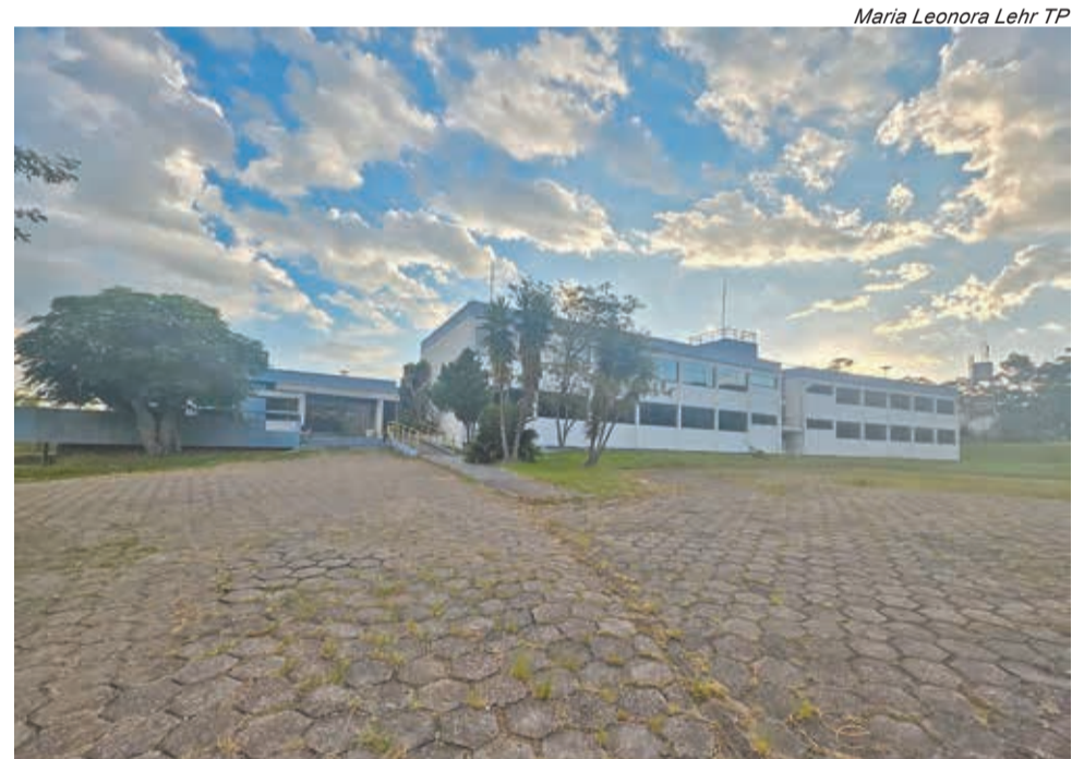
Parte do prédio da empresa foi cedido para o funcionamento da escola