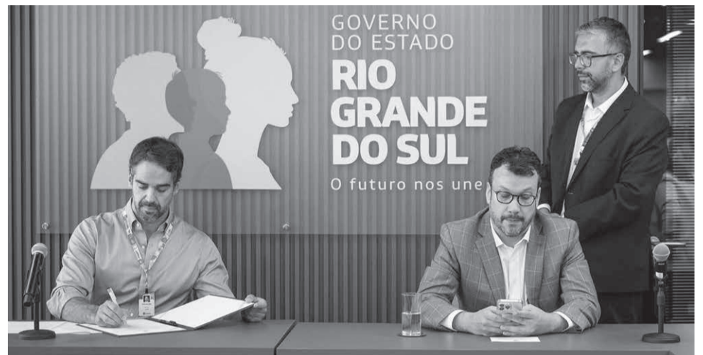
Para o governador, a transição é uma necessidade ambiental, diante da urgência climática que o mundo vive, e uma grande oportunidade

“Estamos muito alinhados às diretrizes do governo e bastante ansiosos para iniciar as próximas etapas. O prazo estimado de implantação é de cerca de 21 meses, considerando aquisição de equipamentos e todo o desenvolvimento do projeto. Além da aplicação no arrefecimento industrial, vamos desenvolver linhas de pesquisa para avaliar novos usos para o hidrogênio verde, ampliando as possibilidades e fortalecendo ainda mais a cadeia