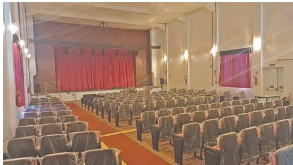
Local passou por revitalização total. Na foto, as 200 novas cadeiras já instaladas, mas ainda com os plásticos de proteção

Conforme o TP teve acesso, o custo total da obra de reforma e revitalização do teatro ultrapassou R$ 900 mil. Entre as intervenções elencadas estão execução de reforma e Plano de Prevenção e Proteção Contra Incêndios (PPCI), aquisição e instalação de poltronas para o auditório, equipamentos de sonorização e iluminação decorativa e led, implementação de obras de acessibilidade com reforma do piso e forro da área da plateia, aquisição e instalação de conjunto cênico, aquisição de projetor multimídia profissional, reforma