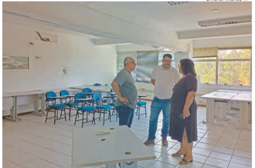
Durante vistoria, foram verificadas as necessidades do local