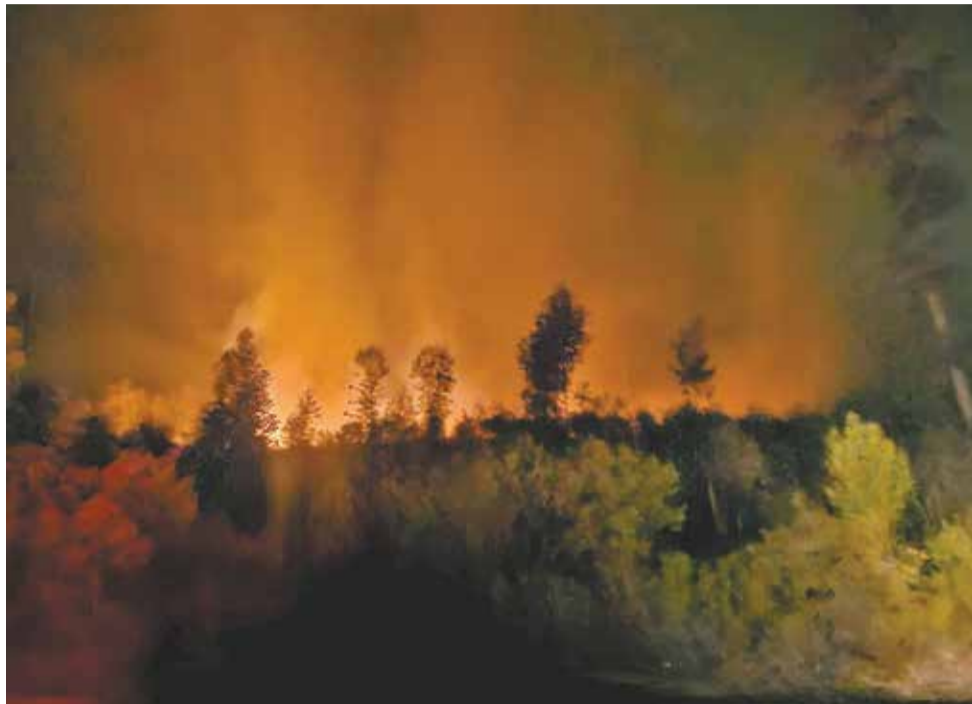
Uma grande área de mata de eucaliptos pegou fogo durante dias