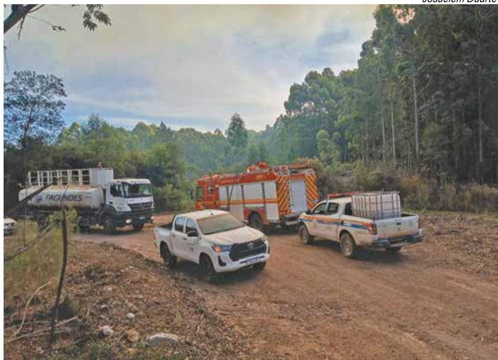
União de vários órgãos foi fundamental para traçar uma estratégia de combate às chamas

Não é primeira vez que uma área imensa do chamado Candiotão - local onde se projetou uma mega-usina termelétrica no final da década de 1970 e início dos anos 1980 e que acabou não saindo do papel, arde em chamas. Durante dois dias esta semana novamente, o local foi vítima de um incêndio criminoso, assustando a comunidade de Candiotã.