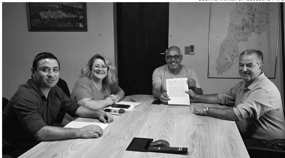
Sabrina Monteiro/Assessoria PMC

A Prefeitura não revelou qual será o índice que irá propor agora. O último reajuste foi em