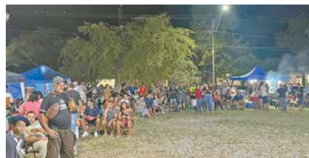
Festividade reuniu um grande público