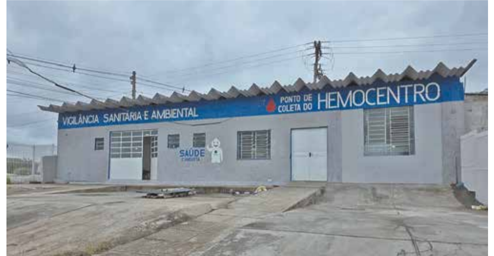
Prédio está passando pelas últimas adequações