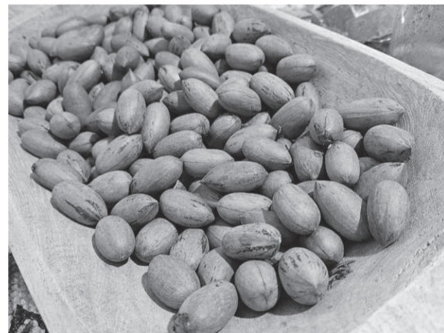
Candiota está com cerca de 10 produtores