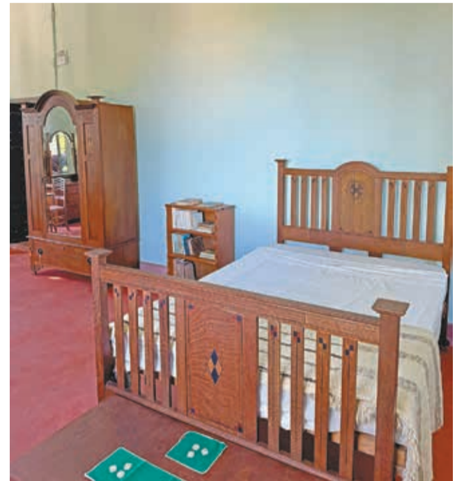
Um dos cômodos ocupados pela família Assis Brasil

O projeto é realizado pela Associação Castelo de Pedras Altas, entidade sem fins lucrativos criada em 2022 com o objetivo de mobilizar esforços para a preservação e restauração do conjunto patrimonial do Castelo. A iniciativa conta com patrocínio das empresas Plasbil, Rede Super, Coradini e Podal, além do apoio do Instituto do Patrimônio Histórico e Artístico do Estado (IPHAE), da Prefeitura de Pedras Altas e