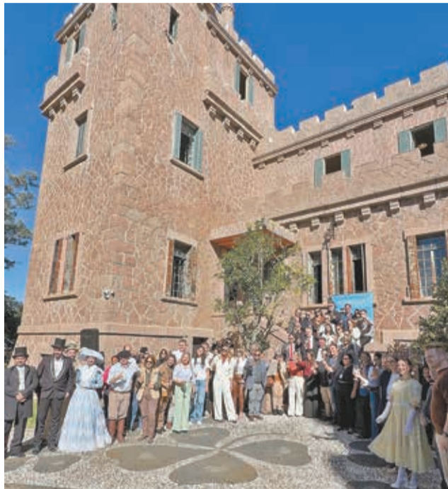
Cerimônia marcou finalização da etapa

O projeto também realizou ações educativas e de formação de público, incluindo a realização de um concurso cultural para seleção de participantes